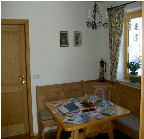
Das Wohn- und Esszimmer

Unser Haus befindet sich an ruhiger Ortsrandlage mit herrlichen Blick auf die Ammergauer Alpen. Die neuerbaute Ferienwohnung bietet Ihnen größtmöglichen Komfort für Ihren erholsamen Urlaub und ist nach den Qualitätsanforderungen des Deutschen Tourismusverbandes mit 4 Sternen ausgezeichnet, auch sind wir zertifizierter "Auszeit" Betrieb der Ammergauer Alpen. Von unserem Haus können Sie direkt Wanderungen zur Ammerschlucht oder zu der Kneippanlage Bärenbachweg unternehmen.